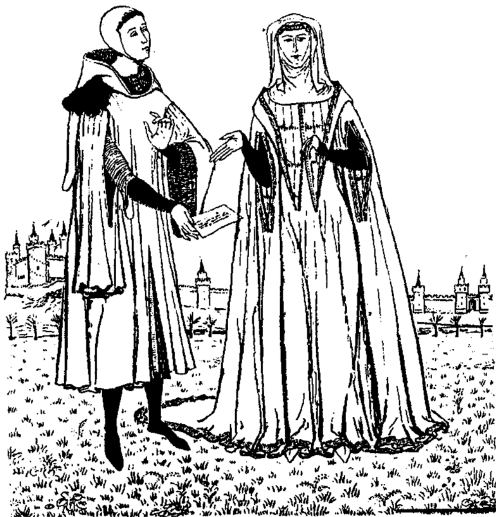
Hình 1.2. Trang phục châu Âu thời vua Edward (năm 1330)

xương và liên kết với nhau bằng chỉ làm từ các sợi gân. Bộ sari (áo quần của phụ nữ Hin-đu) của người Ấn Độ, bộ poncho (loại áo choàng bằng một tấm vải to có khe hở ở giữa để chui đầu qua) của phương Tây thế kỷ 14 (h.1.1 và h.1.2) là những bộ trang phục được tạo theo cách này.